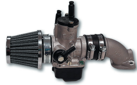
PHBH 28 BD